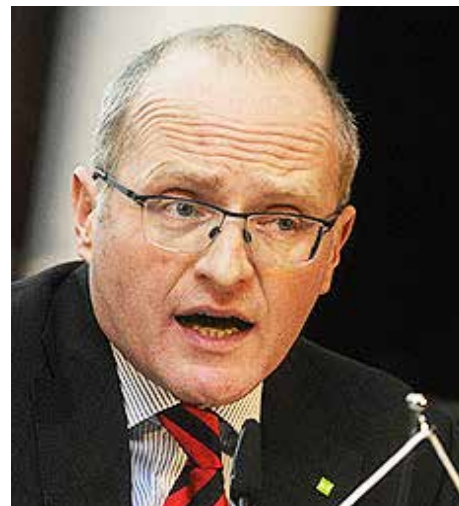
Volker Plass ist Unternehmer und Bundessprecher der Grünen Wirtschaft

Für viele SteuerzahlerInnen ist es schon schwer verständlich, dass nicht nur Erwerbslose, sondern auch Menschen, die gar nicht arbeiten wollen, eine staatliche Alimentierung erhalten sollen. Wenn für die Finanzierung dieses Grundeinkom-