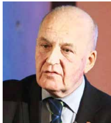
Götz W. Werner ist Gründer und Aufsichtsratsmitglied des Unternehmens „dm-drogerie markt“

Die Frage ist: Wie schaffen wir es, die Kluft zwischen dem gesellschaftlichen Be-