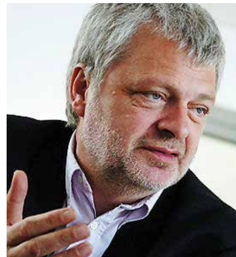
Karl Öllinger ist Abgeordneter der Grünen im Parlament

Das Problem beginnt dort, wo das Grundeinkommen als der entscheidende Schlüssel für die in dem Zitat beschriebene grundlegende Änderung der Gesellschaft gesehen wird. Ich halte es noch immer mit dem Spruch von Umberto Eco: „Es gibt für jedes komplexe Problem eine ein-